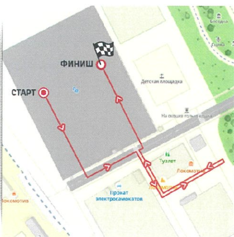
Дистанция 500 м