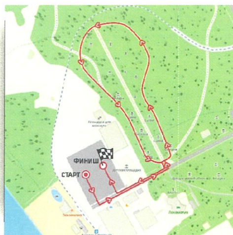
Дистанция 1520 км (1 круг)